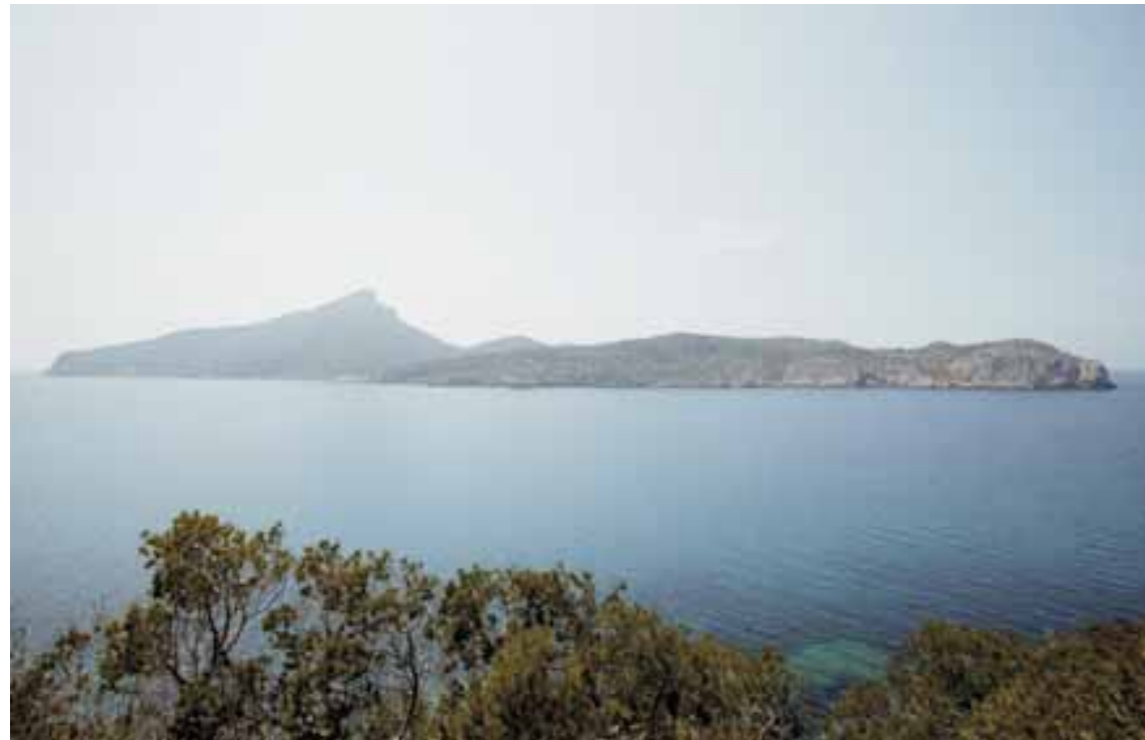
Frente a la isla Dragonera / Opposite the island of Dragonera / Gegenüber der Insel Dragonera