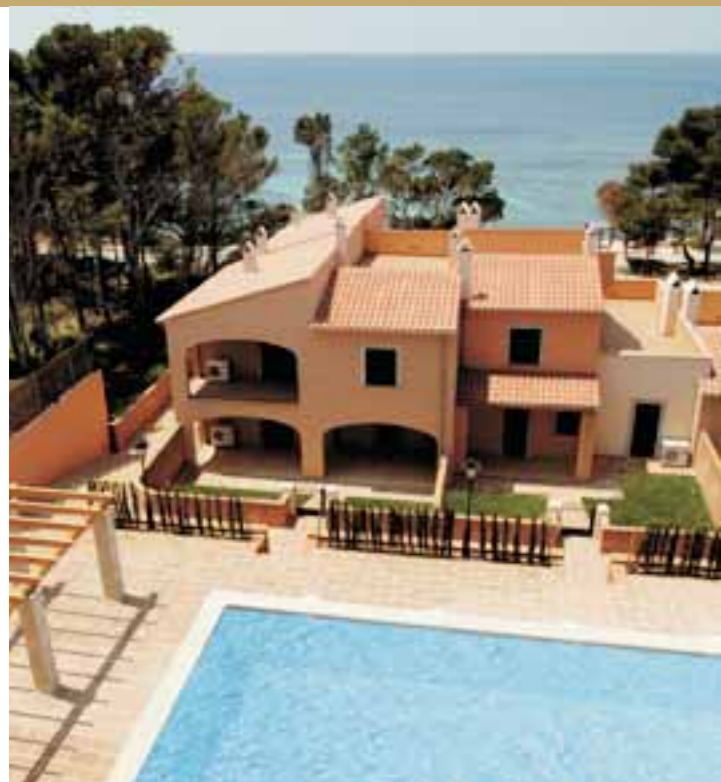
Bungalow / Bungalow / Bungalow

Sant Elm es un pueblo de pescadores situado en la bella zona de Andratx (Mallorca) frente a la mitica isla de la Dragonera. Es un lugar privilegiado para el descanso y la contemplación de la naturaleza.