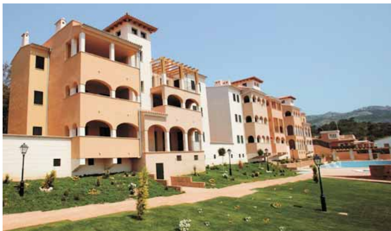
Apartamento / Apartment / Apartment

Sant Elm, ist ein Fischerdorf das in einer sehr schönen Gegend von Andratx (Mallorca) und gegenüber der mystischen Insel Dragonera liegt. Ein privilegierter Ort der Erholung und der Natur. In Sant Elm befindet sich das Residencial Palomera, ein Komplex aus Apartments und Bungalows mit 1 und 2 Schlafzimmer, komfortabel ausgestattet, direkt am Meer und in der Nähe des Yachthafens von Andratx.